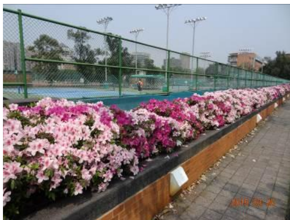
蒲葵道上杜鵑花花開燦爛

今年度杜鵑雖受暖冬及花期遇雨等天候影響，導致花期不一致，但花團錦簇、花期延長，仍舊讓師生賞心悅目，徜徉在花海中。