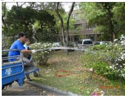
雜工班養護杜鵑工作情形

天氣逐漸轉熱，蚊蟲滋生高峰期即將到來，事務組於3月16-18日進行校總區及水源校區戶外環境消毒，以阻絕蚊蟲孳生管道，預防登革熱等疾病發生。