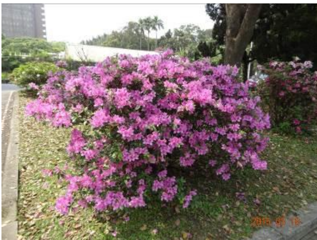
烏來杜鵑花色嬌嫩