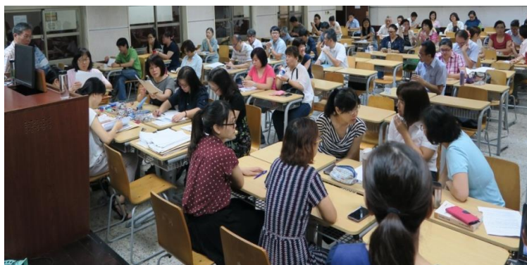
(105 年 7 月 12 日外文圖書開標實況)

本年度圖書共同供應契約共約包括 PQDT 電子論文、西文電子圖書及外文圖書共約，分別於 6 月 15 日、7 月 5 日及 7 月 12 日決標。本年度經圖書館調查各大專院校與圖書館共 87 個單位有共同需求，本組於辦理招標時即將其納入適用機關，得逕行利用本共約採購。