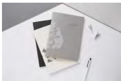
2019 年本校意象紀念品

出版中心現針對 2020 年 6 月的畢業季進行新商品規劃，預計推出 2020 畢業熊。同時，持續洽談合作通路商，提供愛用者更多元的購買管道。