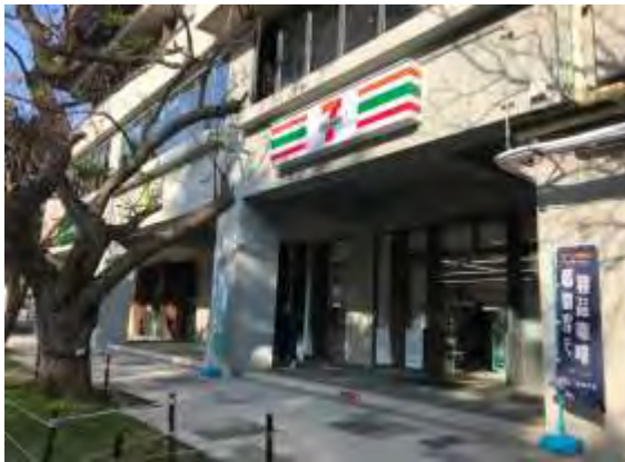
卓聯 1 樓商場外觀照

1、2 樓商場之後於 108 年 4 月辦理統包招商公告，5 月 27 日召開評選評定「美德耐股份有限公司」為最優勝廠商，引進 7-11、眼鏡行、手機店、咖啡簡餐、中式麵食點心、速食店及中餐廳，自 9 月起陸續開幕並於 109 年 2 月 3 日全面提供服務。