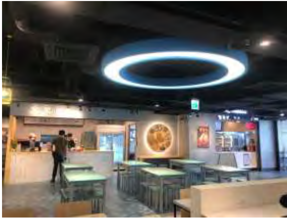
卓聯 2 樓商場現況照