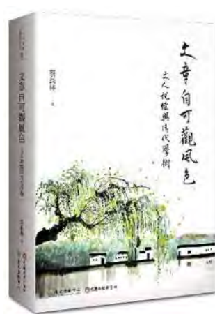
Digitalizing the Global Text: Philosophy, Literature, and Culture ，《文章自可觀風色——文人說經與清代學術》二書書封