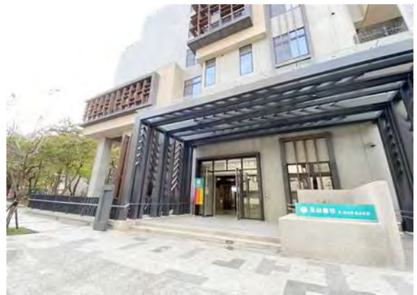
卓聯 1 樓商場外觀照