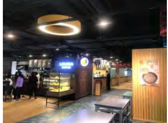
卓聯 2 樓商場現況照

本場地面積約 63.5 坪 (210 m 2 )，因原租約屆期，歷經 5 次公開招商流標，迄第 6 次公告僅 1 家廠商投標。經評選結果由「台灣普客二四股份有限公司」得標，於 108 年 11 月 20 日完成簽約，租期 3 年，109 年 1 月 3 日正式營運，提供停車服務。