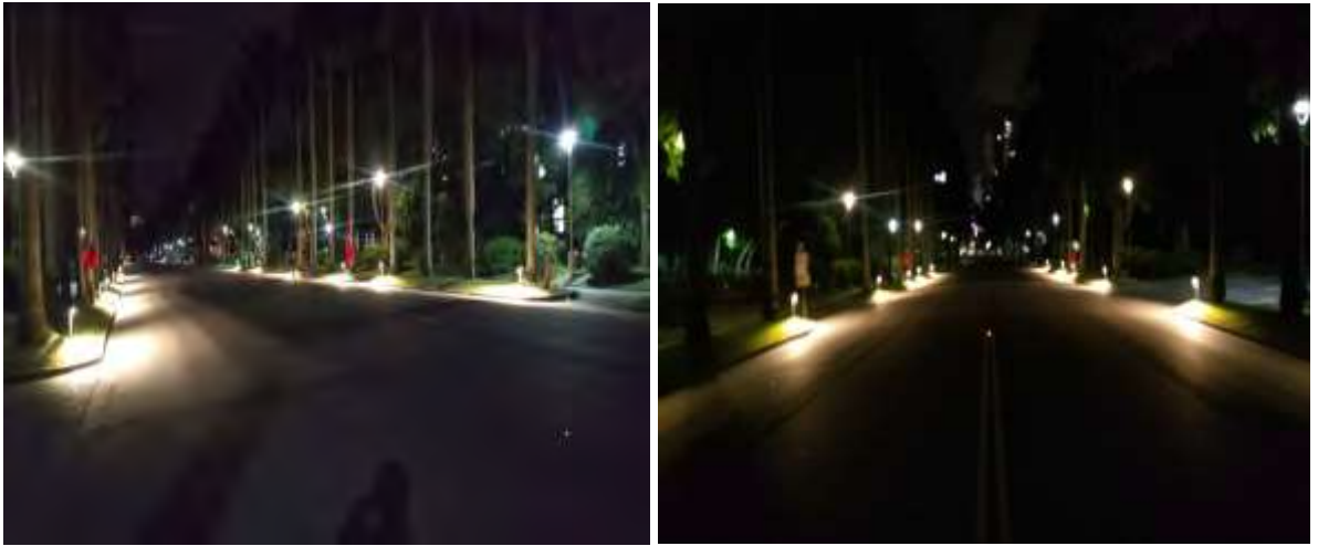
椰林大道裝設投射燈測試照

燈及 2 處投射燈測試，測試效果佳，將續於椰林大道兩增設投射燈，以增加道路照度。